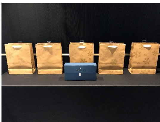
Cartelería Apafpv y regalos para los tres ponentes y los dos invitados de la Administración Tributaria